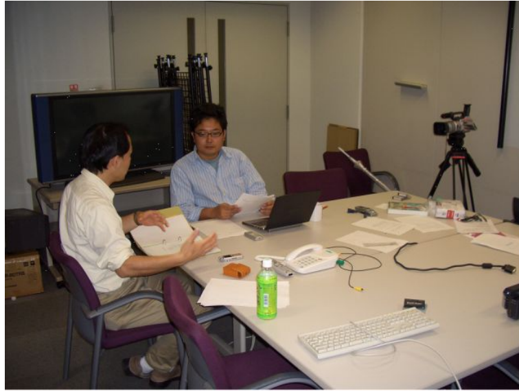
図 2 実験風景